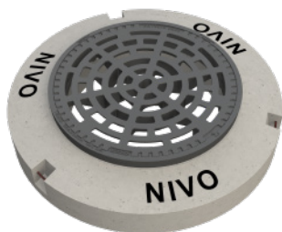
Figur N636 Figur N639