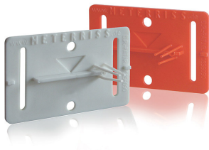
RS21 Meterriss-Plakette, selbstklebend zur dauerhaften Sicherung des Meterrisses bis nach den Putzarbeiten