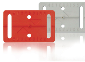
RS10 Meterriss-Plakette, für Baustellen ohne Putzarbeiten