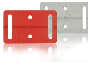
RS11 Meterriss-Plakette, selbstklebend, für Baustellen ohne Putzarbeiten