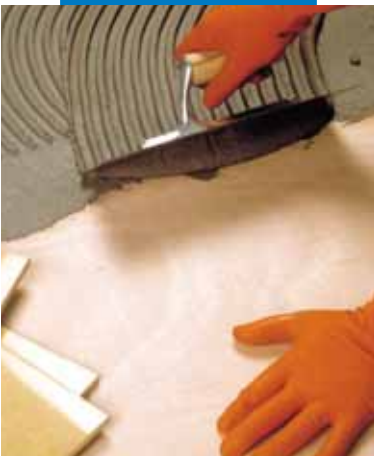
Verlegung von Feinsteinzeug mit Elastorapid