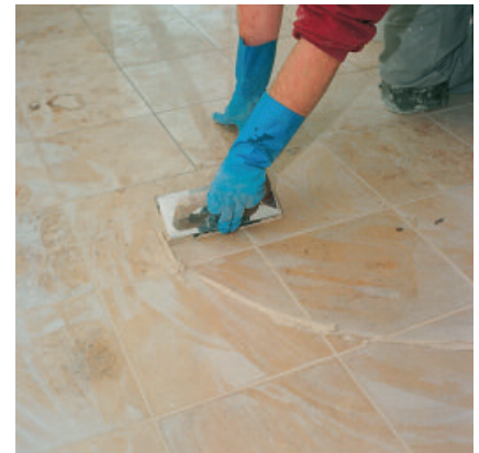
Mit PCI Carrafug können auch empfindliche Naturwerksteinbeläge sicher und verfärbungsfrei verfugt werden.