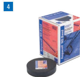
Ampacoll® ND.Band: Nageldichtband