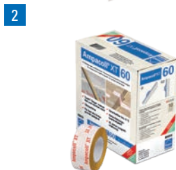
Ampacoll® XT 60: Acrylklebeband