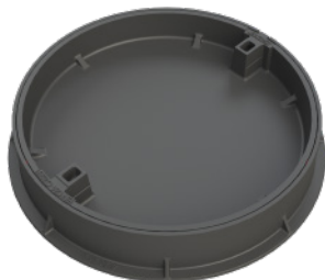
Figur 470 Figur 476