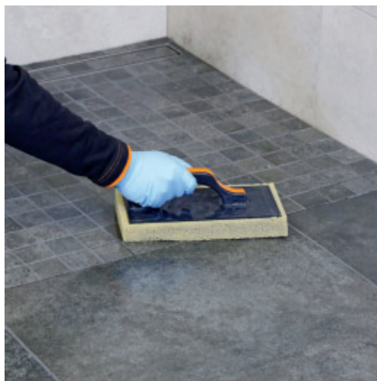
Anschließend mit dem Schwammbrett den Restschleier aufnehmen und die Fläche sauber waschen.