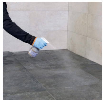
Vor dem finalen Waschgang wird nach ca. 60 Min. PCI Durapox Finish (flüssig) auf die Fläche aufgesprüht.