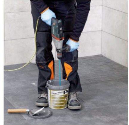
Gründlich Mischen. Um eine homogene Mischung zu gewährleisten, sollte das Gebinde umgetopft und nochmals vermisch werden.