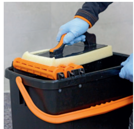
Wichtig dabei ist, dass das Waschwasser in regelmäßigen Abständen (ca. 5 - 10 m 2 ) gewechselt wird.