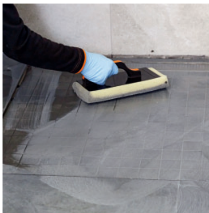
Nach ca. 10 - 45 Min. die eingefugte Fläche mit einem Schwammbrett anemulgieren und sauber abwaschen.