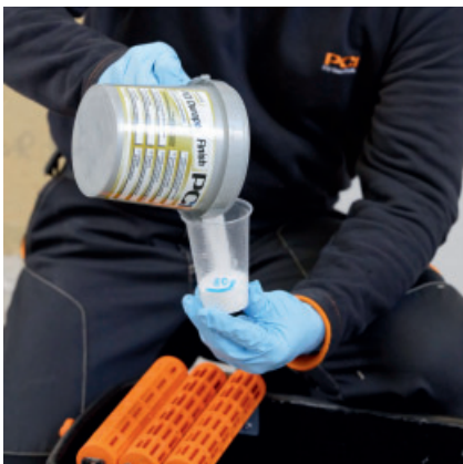
Alternativ kann auch PCI Durapox Finish (Konzentrat) MV 1:100; 5l Wasser; 50 g Durapox Finish; direkt in das Waschwasser hinzugegeben werden.