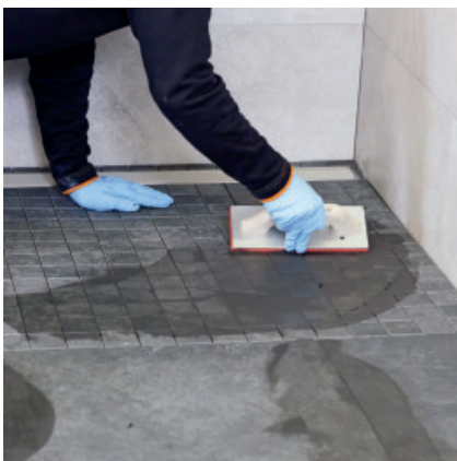
PCI Durapox Premium (Multicolor) mit einer Hartgummifugscheibe in die Fugen einbringen.