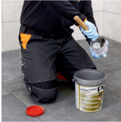
Die Härterkomponente in die Basiskomponente geben.