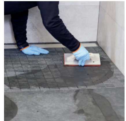
Sehr leichtes Verfugen ohne Restschleier mit PCI Durapox Premium (Multicolor).