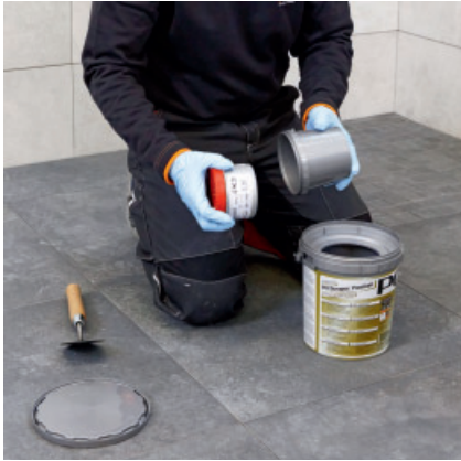
PCI Durapox Premium (Multicolor) (2 kg) öffnen und die zweite Komponente herausnehmen.